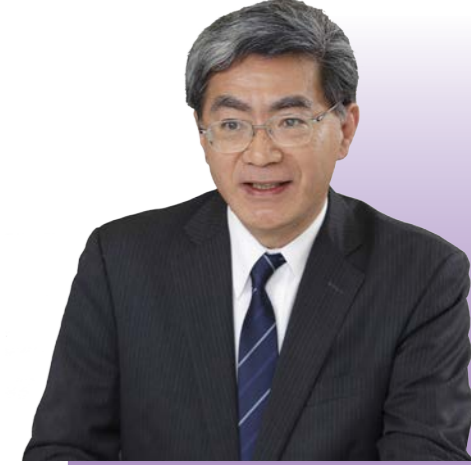
東京都健康長寿医療センター研究所 研究部長