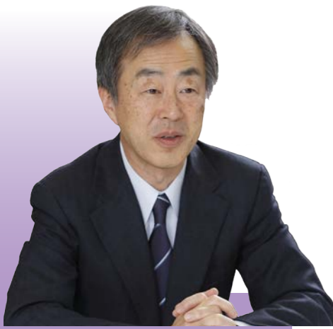
大阪大学大学院医学系研究科 精神医学教室 教授