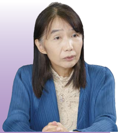
砂川市立病院認知症疾患医療センター センター長