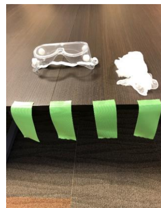
手首の手袋を止めるための養生テープを4枚用意する。長さは約15cm程度。