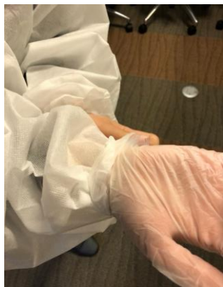
ガウンの袖をインナー手袋に入れる