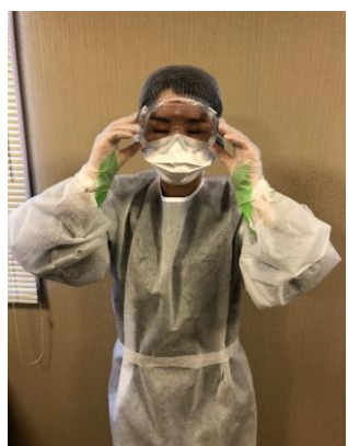
ゴーグル、もしくはフェイスシールドを着用する。フェイスシールドは、下を向いた時にガウンに付かないように調整する。