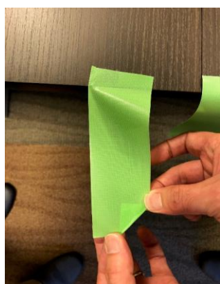
養生テープは角や片方の端を折りたたんでおくと、貼り付けるときに手袋につかなくてよい。