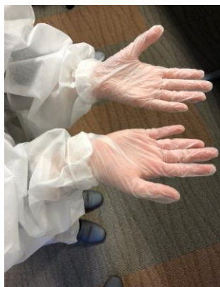
両手首とも同じに入れる