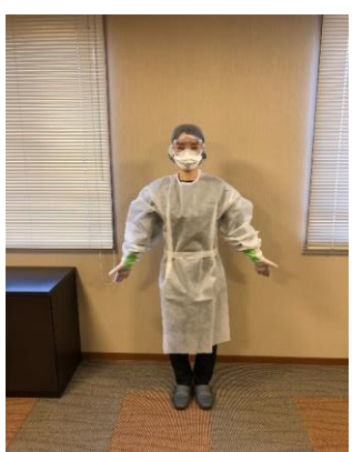
きちんと着用できているかを鏡を見て確認するか、誰かに見てもらう。