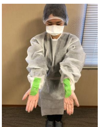
手首の内側を養生テープで固定する。この時、手首を巻くように貼り付けると、脱ぐときに手首が抜けなくなるので注意。