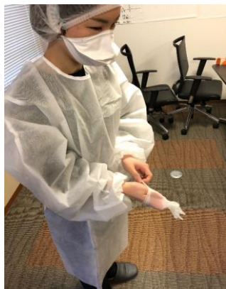
インナー手袋をつける