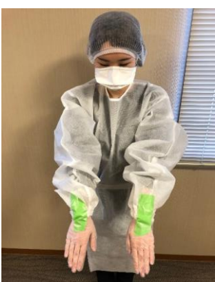
手の甲側も同じように固定する。