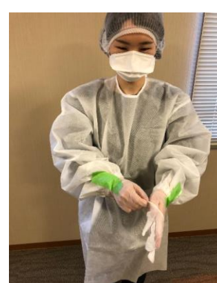
インナー手袋の上からアウトター手袋を着用する。